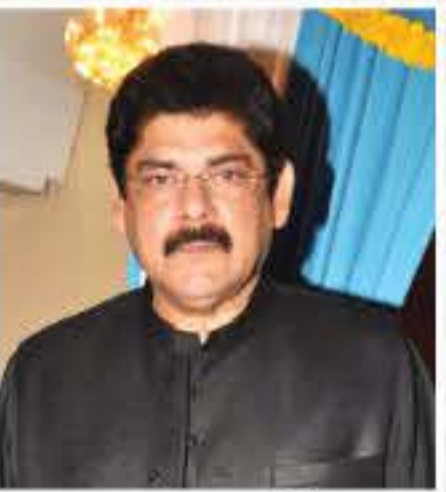
পংকজ ধীৰ (বলিউড অভিনেতা)