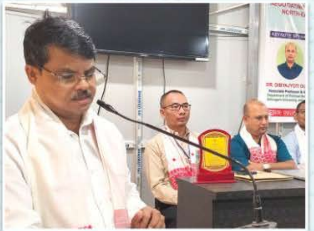
ৰাষ্ট্ৰীয় আলোচনা সভাৰ দৃশ্যাংশ