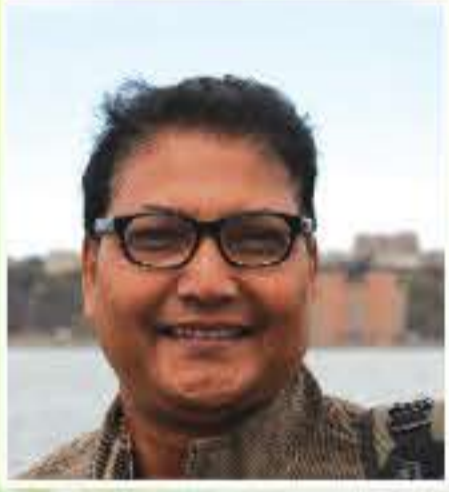
অনুভৱ তুলসী (কবি)