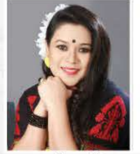
গায়ত্ৰী হাজৰিকা (কণ্ঠশিল্পী)