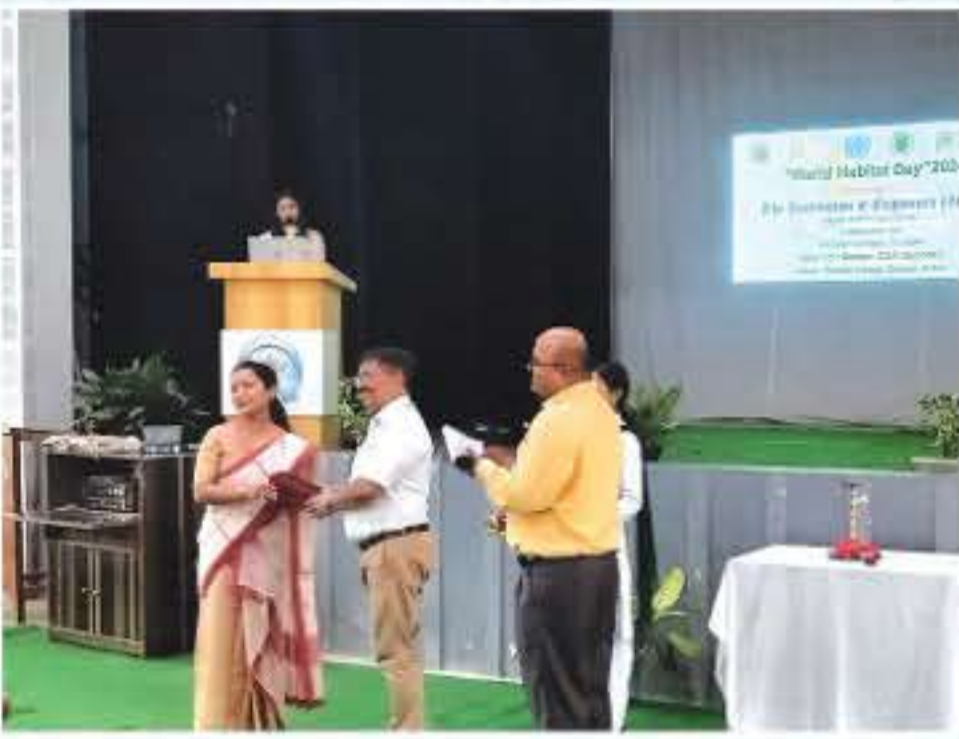
World Habitat Day পালন