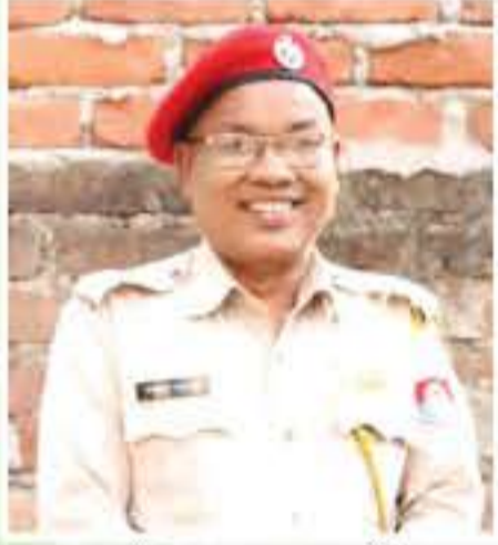
ফাইল' বসুমতাৰী (অভিনেতা)