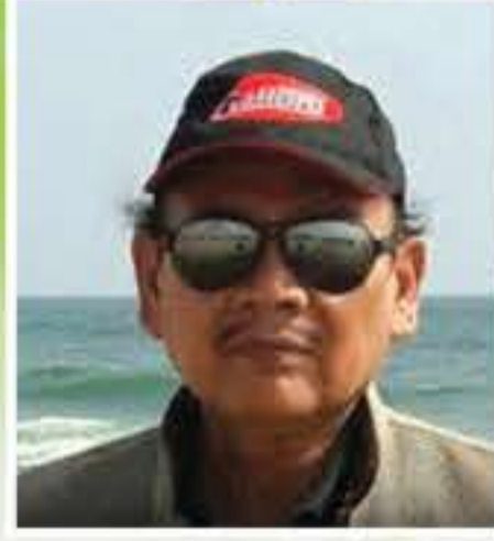
তিম'থি দাস হাঙ্গে (চলচ্চিত্ৰ পৰিচালক)