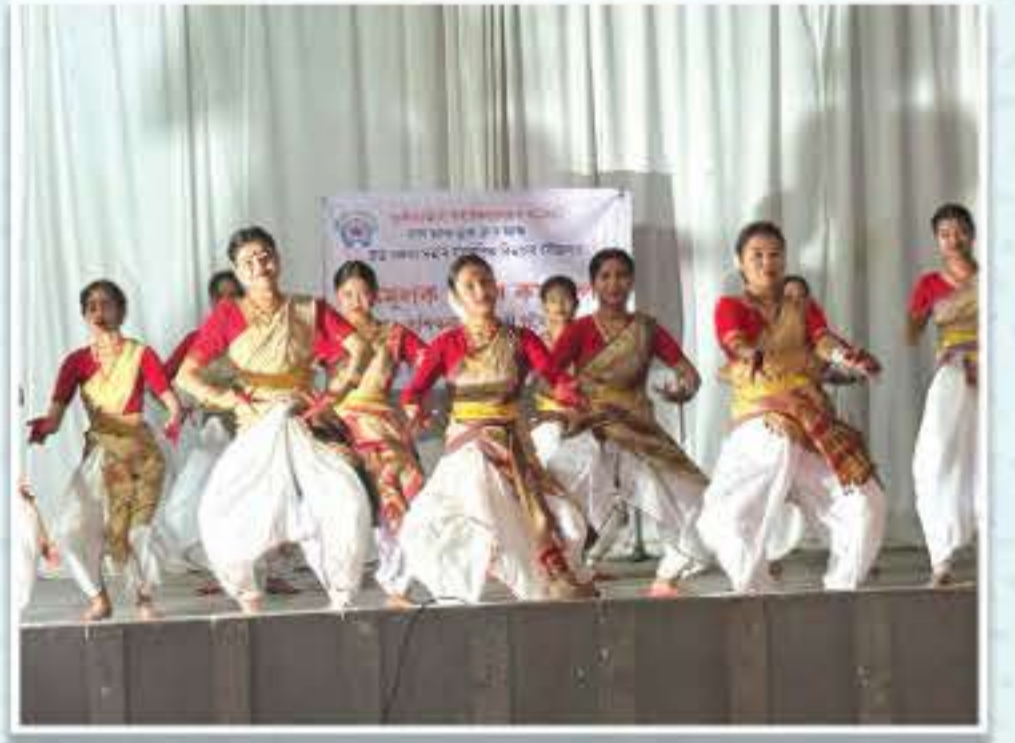
ভাল আৰু ড্ৰামা ক্লাবৰ উদ্যোগত সৃষ্টিমূলক নৃত্যৰ কৰ্মশালা