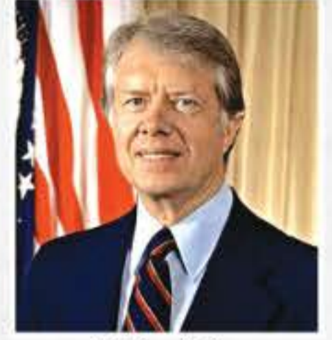
জিমি কাৰ্টাৰ (আমেৰিকাৰ প্ৰাক্তন ৰাষ্ট্ৰপতি)