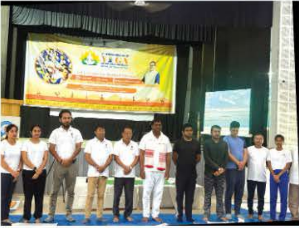
দুলীয়াজান সম জিলাৰ উদ্যোগত যোগ দিবস পালন