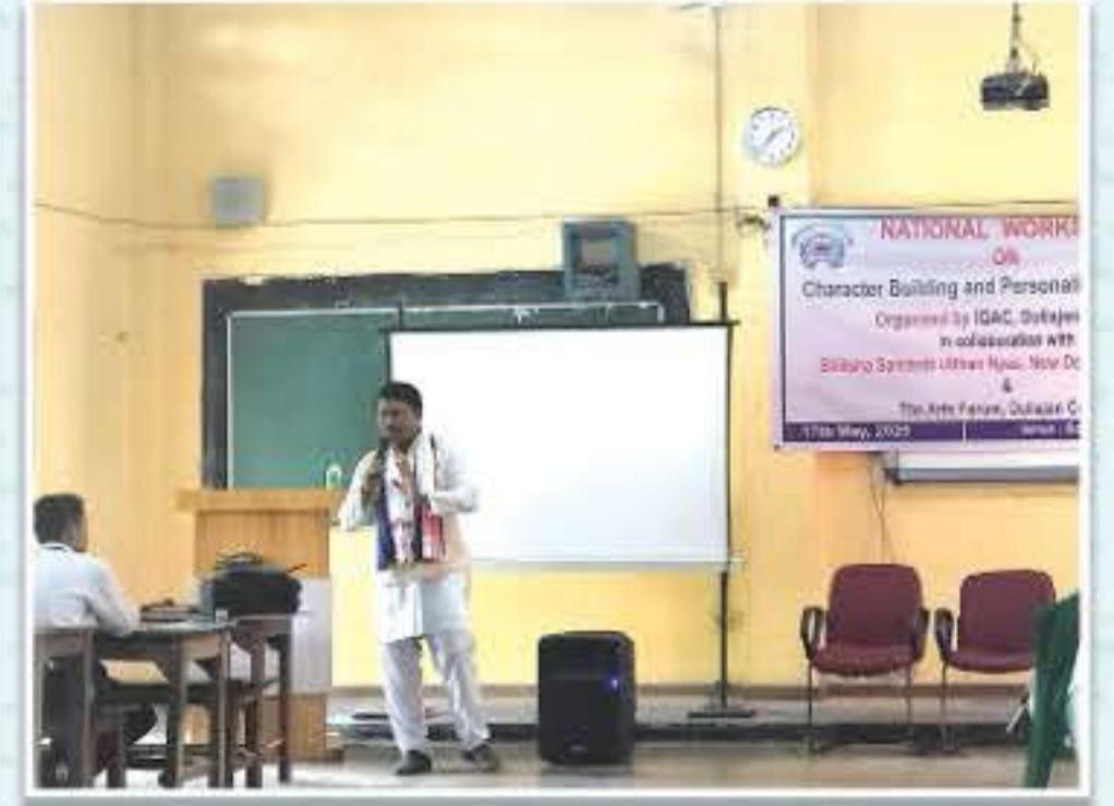
চৰিত্ৰ গঠন ব্যক্তিত্ব বিকাশ শীৰ্ষক কৰ্মশালাত ভাষণৰত অৱস্থান সমল ব্যক্তি