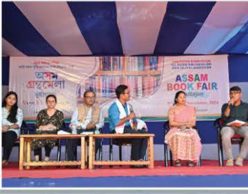
অসম গ্ৰন্থমেলা দুৰ্লীয়াজানৰ যুৱলেখক সমাবোহ উন্মীলনত অংশগ্ৰহণ কৰা মহাবিদ্যালয়ৰ যুৱ শিক্ষক আৰু লেখকসকল