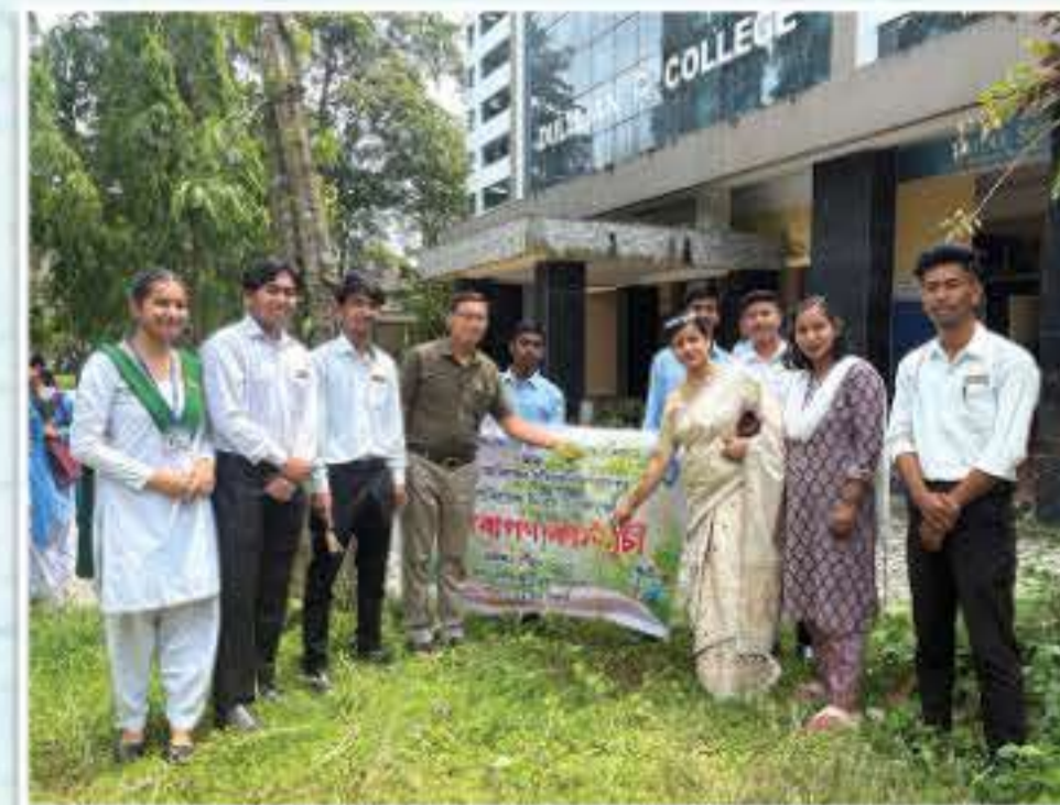
বিশ্ব পৰিবেশ দিবস উপলক্ষে মহাবিদ্যালয়ৰ প্ৰাংগনত গছপুলি ৰোপণ কাৰ্যসূচী