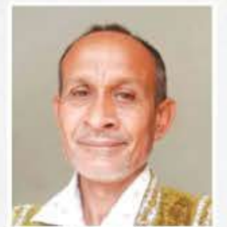
অজিত বৰঠাকুৰ (নাট্যকাৰ)