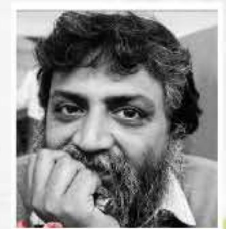
তৰুণ ভাৰতীয়া (কবি)