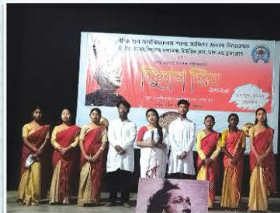
বিশ্বৰাভা দিবস পালন