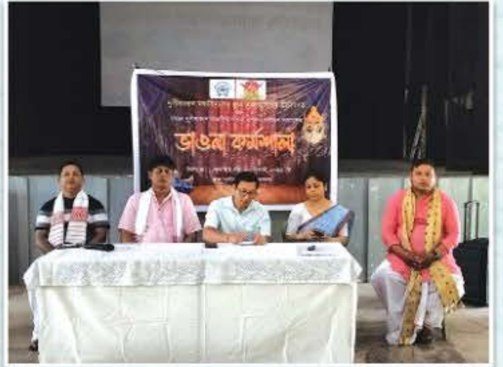
ভাওনা কৰ্মশালাৰ শুভাৰম্ভণি অনুষ্ঠান