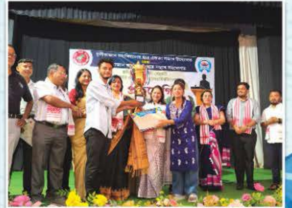
মহাবিদ্যালয়ৰ বাৰ্ষিক তৰ্ক প্ৰতিযোগিতাৰ বাঁটা বিতৰণী অনুষ্ঠান