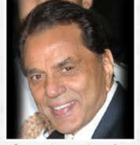
ধৰ্মেন্দ্ৰ কেৰাল কৃষ্ণন দেউল (বলিউড অভিনেতা)