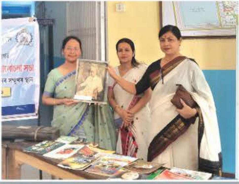
মহাবিদ্যালয়ৰ গ্ৰন্থাগাৰৰ উদ্যোগত পুৰণি কিতাপ আৰু আলোচনীৰ প্ৰদৰ্শনী আৰু আলোচনা সভা