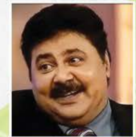
সতীশ শ্বাহ (বলিউড অভিনেতা)