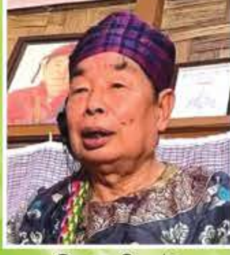
বিচানং চিংফৌ (চিংফৌ ৰজা)