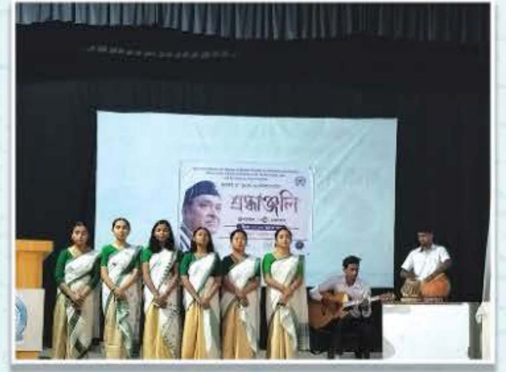
ভূপেন হাজৰিকাৰ মৃত্যু দিবসৰ অনুষ্ঠান