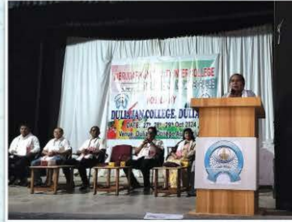
ডিব্ৰুগড় বিশ্ববিদ্যালয়ৰ আন্তঃ মহাবিদ্যালয় ডবাখেল প্ৰতিযোগিতাৰ বাঁটা বিতৰণী অনুষ্ঠান