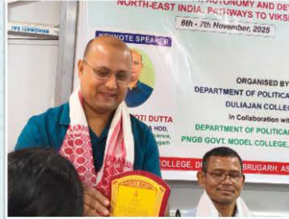
ৰাজনীতি বিজ্ঞান উদ্যোগত আয়োজিত ৰাষ্ট্ৰীয় আলোচনা সভাৰ সমল ব্যক্তি