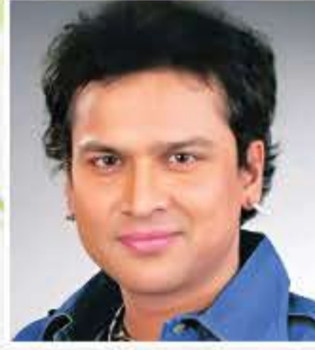
জুবিন গাৰ্গ (কণ্ঠশিল্পী)