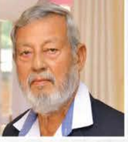
সমৰেন্দ্ৰ নাৰায়ণ (চলচ্চিত্ৰ পৰিচালক)